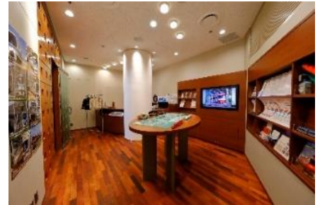
「シーニックキングルーム (31㎡)」