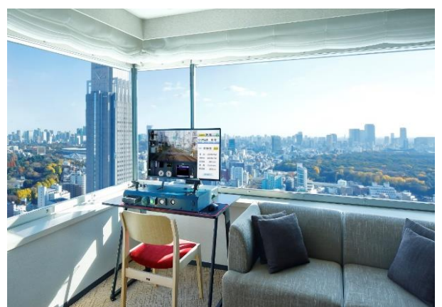
特急ロマンスカー・SEの座面を用いた椅子と パノラミックキングルームからご覧いただける風景 写真はイメージです。