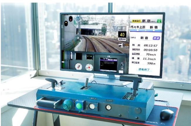
特急ロマンスカー・EXEの運転台機器を用いた 小田急かんたんシミュレーター

2021年4月にスタートした小田急ホテルセンチュリーサザンタワーの3つのコンセプトルームは、12月まで延べ121組のお客さまにお楽しみいただきました。そのなかで最もご希望をいただいた「小田急の電車を運転してみたい」という声を受け、本シミュレーターの開発に至りました。小田急グループでは、お子さまと一緒にご家族で安心して電車を楽しめる企画を通じて、ご家族の心に残る素敵な思い出づくりを提案してまいります。