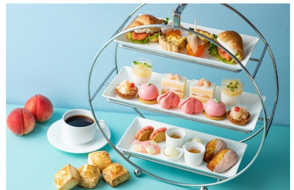
「ピーチアフタヌーンティー」 写真は2名様分