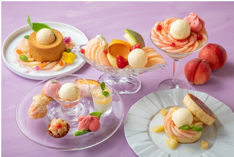
▲オーダーから楽しい5種類のピーチスイーツ（イメージ）

【ウェブサイト】 https://southerntower.co.jp/restaurant_lounge/southcourt/peach_fair/