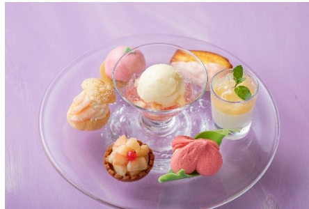
▲7種の味わい 「ピーチスイーツセレクション」 ¥3,553（4,300）