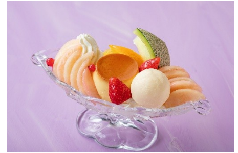
▲固めのプリンがきめ手 「桃のプリン・ア・ラ・モード」 ¥3,553（4,300）