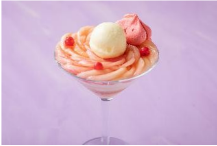
▲かわいいマカロンを添えた 「桃パフェ」 ¥3,719（4,500）