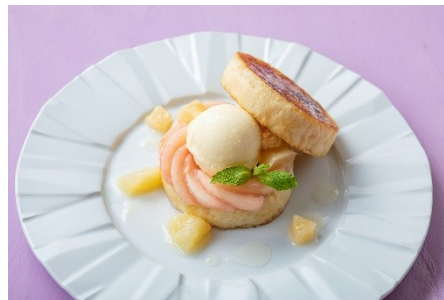
▲「パンケーキのようなフレンチトースト」 東京産はちみつ添え ¥3,233（3,900）