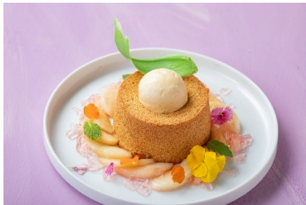
▲ピーチティー香る 「シフォンケーキ」 ¥3,471（4,200）